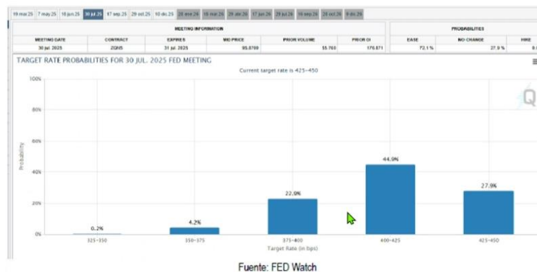
Gráfico no. 6: Expectativas de disminución de tasas

Nota que en ninguno de los plazos hay un tramo para una posibilidad por encima del 50% de que la tasa baje. La tasa se mantendrá en su lugar, pareciera ser que no bajará y esto ha hecho que los rendimientos crezcan hasta el momento cuando el mercado piense que es saludable que estén esos rendimientos en función del comportamiento inflacionario.